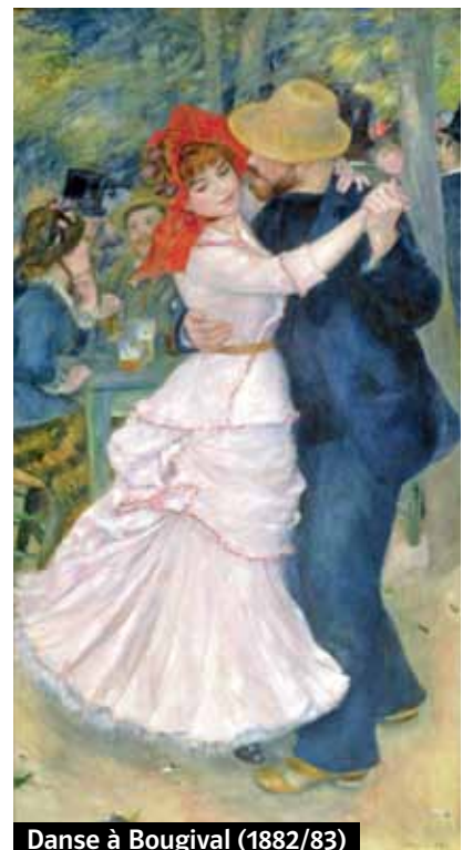
Danse à Bougival (1882/83)